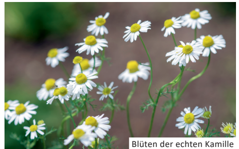
Blüten der echten Kamille

gebietsfremdes Kanadisches Berufkraut ( Erigeron canadensis ) oder heimisches Scharfes Berufkraut ( Erigeron acris ): beide haben jedoch kürzere Blütenblätter