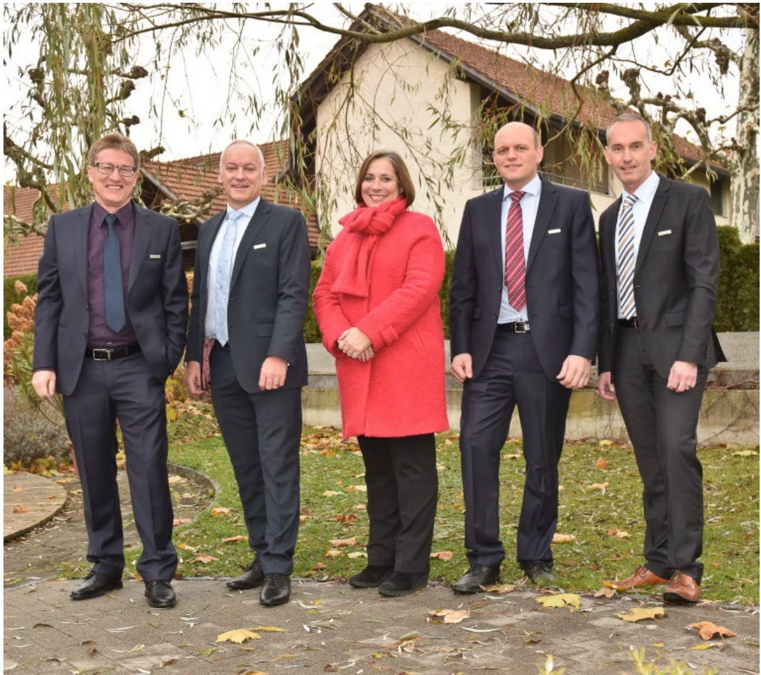
Foto Gemeinderat Sarmenstorf, Amtsperiode 2018/2021