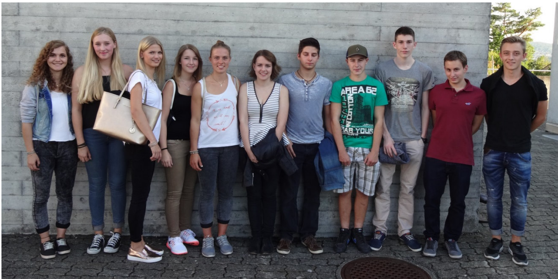
Bild: Sarmenstorfer Jungbürgerinnen und Jungbürger an der Feier 2015.

Nun sind auch die jungen Erwachsenen an den Gemeindeversammlungen herzlich willkommen. Der Gemeinderat hofft, dass die Jungbürger, Jungbürgerinnen in Zukunft am politischen und kulturellen Leben der Gemeinden teilnehmen.