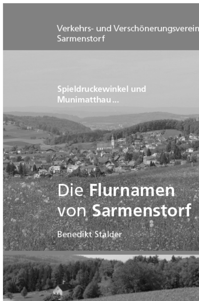
Abbildung: Buch „Die Flurnamen von Sarmenstorf“, 2015. Quelle: Verkehrs- und Verschonerungsverein.